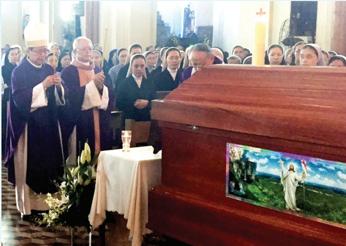
● Bái nhang để tỏ lòng tôn kính Người Quá Cố (Ảnh minh họa)

e. Trong tang lễ, được vái lạy với nhang theo phong tục địa phương để tỏ lòng tôn kính người quá cố.